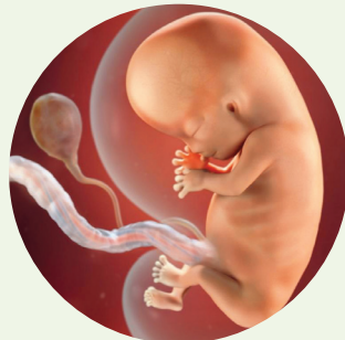
ILUSTRACIJA DJETETA U DOBI OD DESET TJEDANA

Zato što sam jedinstven i neponovljiv, moj je život neprocjenjiv. Međutim, u svijetu se, prema procjenama, dnevno ubije preko 125 000 nerođene djece. Svaki dan! Godišnje je to oko 50 milijuna. U Hrvatskoj je od 1978. do 1990. pobačeno više od 603 000 djece. Danas se službeno bilježi oko 3 500 pobačaja godišnje, ali se vrlo vjerojatno radi o broju većem od 10 000.